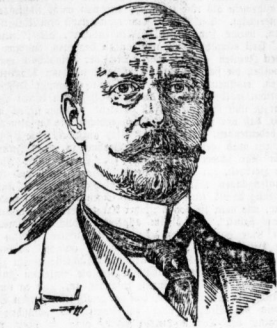
Herzog Johann Albrecht zu Mecklenburg-Schwerin, Regent von Braunschweig.