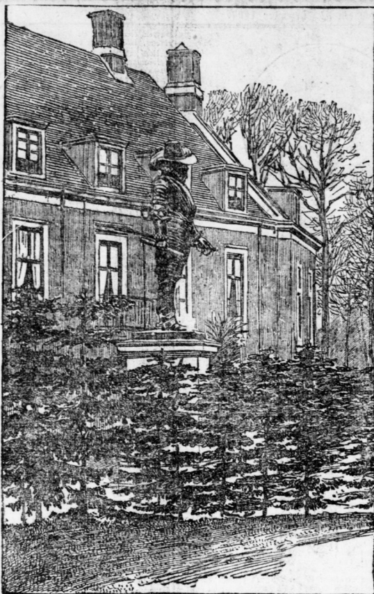
Denkmal des Prinzen Heinrich von Orlanien im Haag.