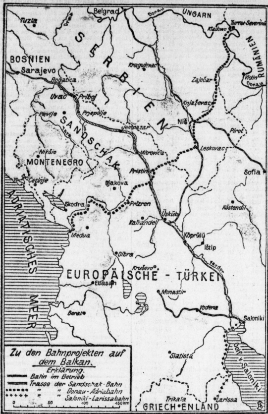
Zu den Bahnprojekten auf dem Balkan.

Erklärung. Bahn im Betrieb Trasse der Sandtschak-Bahn Dunaj-Kanalbahn Saloniki-Larissa-Bahn