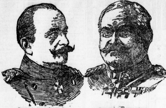
General der Infanterie Ritter Henschel von Gaißenhelm Kommandeur der blauen Armees