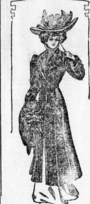
Fig. 1. Langer Mantel aus Pelz oder Samt.