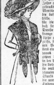
Fig. 3. Breite Stola kleidbar als Mantel aus Kastanienholz.