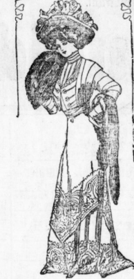
Fig. 2. Rockkleid mit Sontagsfurbelie. Pelz und Stola aus Samt.