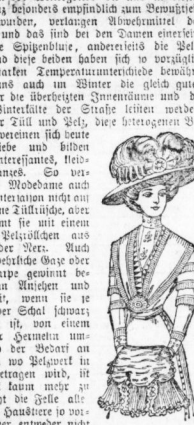
Fig. 4. Breite Stola kleidbar als Mantel aus Kastanienholz.