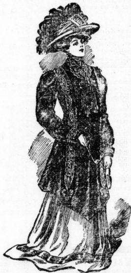
Eleganter Plüschpaletot, reich verzieret mit Posamenten, auch für starke Figuren, Mk. 35.—, etwas einfacher