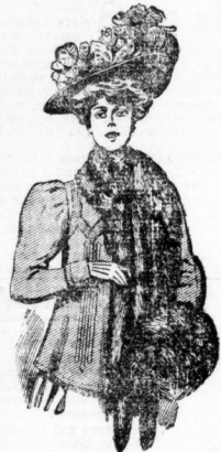
Jackett, gefüttert, mit Tuch- u. Blenden- garnierung, nur in schwarz, Mk. 18.—, 12.—, 8.—, Dasselbe ohne Futter