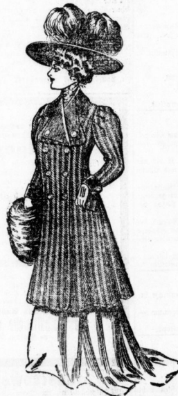
Paletot „Hertha“ Rücken geschweift oder ganz Revers und Säumekragen, in mattgestreift en- gischen Fantasiestoffen