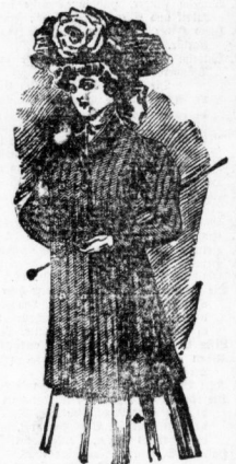
Farbiger Paletot für junge Damen, mit Sammet-Kragen und Tressenverzierung, in grau, oliv und marango,