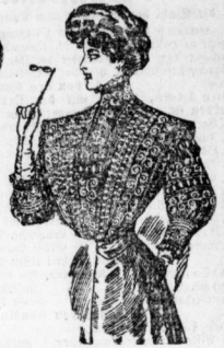
Tüllbluse, Vordertheil u. Rücken reich m. hochgestickt. Tüll-Entre-doux, Aermel in Säum- chen auf Chiffon-Mull gefüttert Mk. 19.—, 15.—, 11.—, 7.—, 3.75