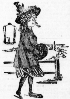
Mädchenpaletot mit Tressen besetzt u. Verschür, in allen Größen vorrätig von Mk. 2.50 an.