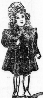
Sammetmäntelchen mit variertem Kragen und Ab- wässerung, in Velour- und Eisbär- stoffen