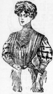
Bluse „Ruth“ i. Wolle m. Tüll- passe auf Futter Mk. 3—

in Baumwollflanell von 90 Pf. an, in Sammet von Mk. 7.— an.