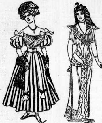
Fig. 2. Robespierre-Kollum aus getrocknetem Stoff.

lesen will oder kann, der wähle ein Vorkursbuch, lasse es mit allem Fleißem dem modernen Schiffsbau aus und lasse die vorerwähnte Form für die Luftschiffahrt zu finden. Das Kollum, Abb. 2 ist z. B. genau einem Robespierre seiner Zeit nachgebildet. Auch Gumpert'sche lassen sich