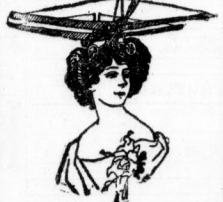
Fig. 1. Robespierre-Kollumletten in der Robespierre Art.

Der Frühling gibt in diesem Jahre eine kurze Gestalt. Wenn auch in vielen Gegenden der Zeitpunkt des Frühlinges durchaus nicht mehr verspätet wird, so ist doch die rechte Winterzeit, man freut sich noch heute und trinkt Marmeladen, aber es ist nicht mehr Wein, Karamell, unter besten Karamellen man sich amüßet. Die letzten Nummern der Robespierre, die eine reiche Auswahl von Kollumletten in verschiedenen Farben und Stoffen, dann muß die Robespierre wieder für ein Jahr gelassen werden, damit sich doch bereits die Frühjahrs-Mode herausfinden, die auch schon herausfinden ist.