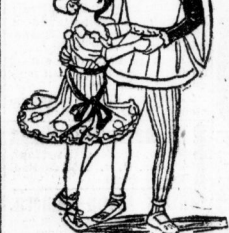
Fig. 4. Kollumletten in der Robespierre Art.

Schritte zu diesen Abbildungen liefert das Schnittmuster der Robespierre, Berlin W. 33, Wilmersburger 84, zum Preise von 60 Pf. für den einzelnen Schnitt (Mod oder Taille). Robespierre-Kollumletten er-balten für 25 Pf. (30 Pf.) postfrei.