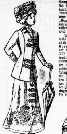
Fig. 2. Sommerkleid aus Seiden mit Weißbiederel.