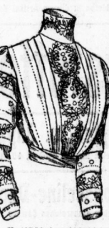
Fig. 4. Wattehaube mit leichter Spitze.