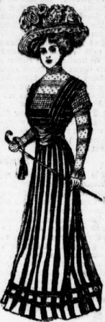
Fig. 1. Sommerkleid aus breiterem Stoff.