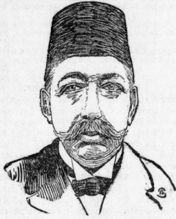
Prinz Mohammed Reischad Effendi.