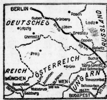
Die Strecke der diesjährigen Prinz-Heinrich-Fahrt.