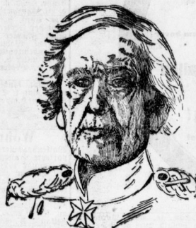
General-Feldmarschall Graf Söfeler.