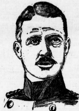
Herzog Ernst II. von Sachsen-Meiningen.

Wir teilen bereits vor einiger Zeit die Namen einer Reihe hervorragender fürstlicher und militärischer Gäste mit, die anlässlich der Kaiserfeste in Merseburg in Halle Wohnung nehmen. Heute geben wir die hervorragendsten dieser Gäste im Bilde wieder und bemerken dabei noch: