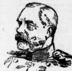
General von Bod u. Polach.