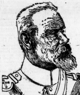
General-Feldmarschall Leopold Prinz von Bayern.