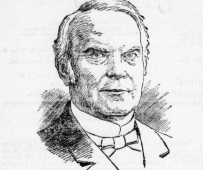
Hofprediger a. D. Stöcker.

... (Hofprediger a. D. Adolf Stöcker ...)