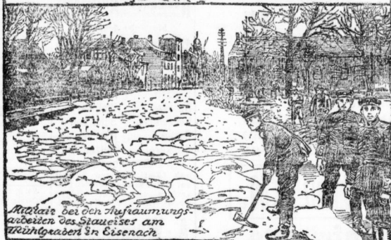
Rütteln des Oberaufstauungsarbeiten des Staues am Mühlgraben in Eisenach