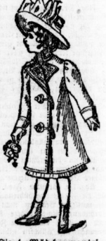
Fig. 4. Wädhemantel mit befeuertem Dreiecks-Neck...