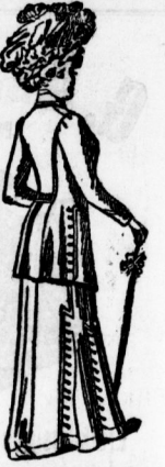
Fig. 3. Saftschleier mit breiten Rändern...