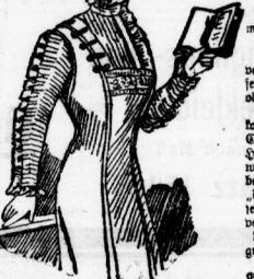
Fig. 2. Reibendrock aus blauer Serge...