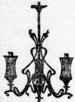
Gaskronen, auch für Hängelicht.