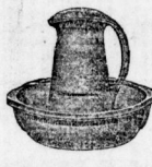
Waschservice 1,85, 2,20, 2,85, 3,85, 4,85, 5,25, 7,85, 8,50, 9,25 bis 20.— Mk.