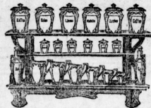
Küchengeräte 9,50, 11,50, 12,50, 13,50, 14,50 bis 34.— Mk.

Niederlage der Königl. Porzellan-Manufaktur in Kopenhagen.