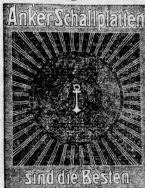
sind die Besten

Erhältlich in allen besseren einschlägigen Geschäften.