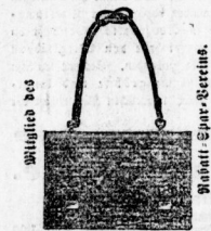
Brief- u. Conventtaschen