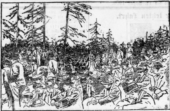
Vom Generalkongress in Schweden: Versammlung von Ausständigen in einem öffentlichen Park.

Der allgemeine Ausstand aller Arbeiter in Schweden hat für das ganze Land außerordentliche Schwierigkeiten herbeigeführt.