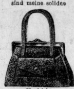
Hochfeine Damentäschchen und Damengürtel

Reisekoffer Reisetaschen Kupekkoffer Hutkoffer Blusenkoffer Rohrplatten- und Rindlederkoffer