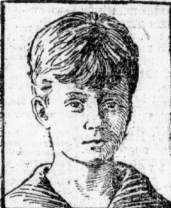
Der Thronfolger Prinz Leopold.