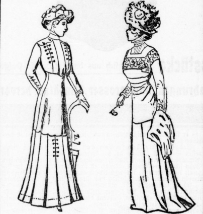
Fig. 1. Hüfttaschenkleid mit Knopfschmuck.

Die spanische Macht ist in der Lage, die ganze Welt zu beherrschen. Die spanische Macht ist in der Lage, die ganze Welt zu beherrschen. Die spanische Macht ist in der Lage, die ganze Welt zu beherrschen.