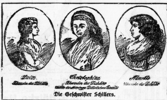
Louise, Schwester des Dichters.

lers, Nanette, wurde 1768 geboren. Sie war das erste Mitglied der Familie, das starb, sie ist am 23. März 1796. Wenige Monate später, im September, starb auch Schillers Vater, der in seiner letzten Lebenszeit Oberschadmeister und Inspektor der herzoglichen Gärten auf der Solitude gewesen war.