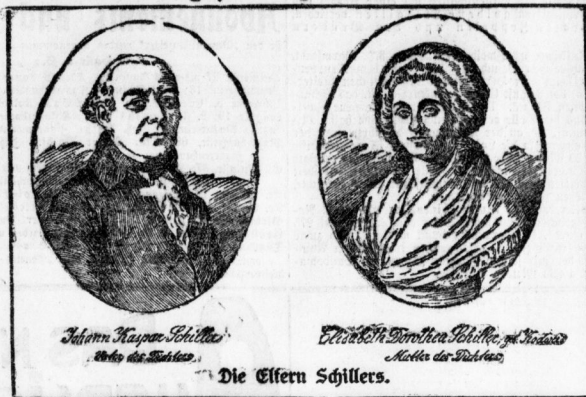
Johann Kaspar Schiller, Vater des Dichters.