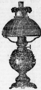
Tischlampe 1.25 bis 14.50.