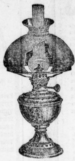
Tischlampe „Perfection“ höchste Veredlung.