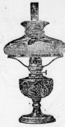
Messinglampe von 4.50 an.