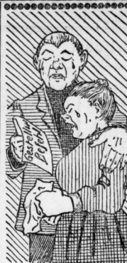
Ausstellung III. Etl. Zur Rekruten-Einstellung.

Schularbeits-Zirkel. Ständige Nachhilfe für Kinder und Mädchen.