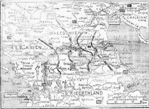
Der Kriegsschauplatz in Albanien.

Achten Sie beim Einkauf auf meine Firma und zwei grosse Schaufensterauslagen.