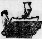
Teppichkehrmaschinen Mk. 1200 1350 1500 2000