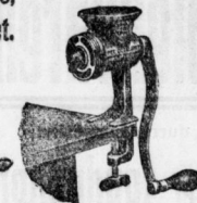
„Climax“-Hacker hackt, schneidet, zerhackt, Mk. 5 50 6 00