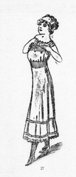
Fig. 27. Neue Kombination aus Batist, in Saumchen genäht, reich garniert mit Schweizer Stickerei und Bandverschönerung.