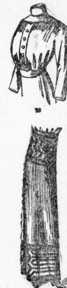
Fig. 28. Glatte Hemdbluse aus Flanel, redestimmig, mit schwarzem Liberty verziert, Kopfputz, apart geformte Ärmel, Hohlhüte mit großen überzogenen Knöpfen besetzt.