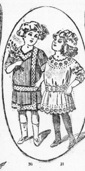
Fig. 29. Zweifelhüftiger Miederrock aus Tuch, in aparter Weise mit gemusterten Seidenschorten garniert. Fig. 30. Babykleidchen aus gestreiftem Wollstoff, mit Blenden aus gestupftem Stoff und farbigen Seidenverstoff garniert.