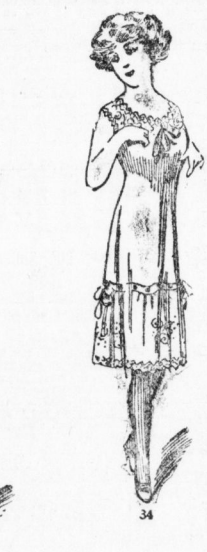
Fig. 32. Hemdbluse aus tolle sponge, mit Streifen und gestopften Blenden, Jabot und Schokragen aus Tüllputze. Fig. 33. Sportrock aus Tuch, dreiteilige Tunika mit zurückgeschlagenem Koll, Formansatz, Knöpfe und Stepperei als Verzierung. Fig. 34. Rosenkombination aus Nansonek, Streifen, Spitzenstreifen, Bandstreifen, hoher Stickereivolant, die gleiche Stickerei bildet den oberen Teil.