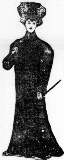
Frühjahrs-Paletot 3/4 lang u. ganz lang, mit Stoff- u. Knopfverzierungen impragniert 18,80 12,25 6 25

Prinzip: Tadelloser Sitz. Beste Verarbeitung. Grösste Auswahl.