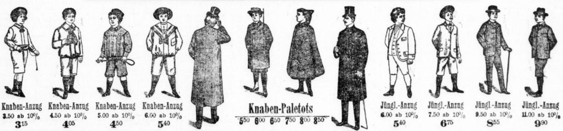
Knaben-Anzug 3.50 ab 10%, Knaben-Anzug 4.50 ab 10%, Knaben-Anzug 5.00 ab 10%, Knaben-Anzug 6.00 ab 10% 3.15 4.05 4.50 5.40 Knaben-Paletots 5.50 6.00 6.50 7.50 8.00 8.50 Jüngl.-Anzug 6.00 ab 10%, Jüngl.-Anzug 7.50 ab 10%, Jüngl.-Anzug 8.50 ab 10%, Jüngl.-Anzug 11.00 ab 10% 5.40 6.75 8.55 9.90

Ferner: Elegante Knaben-Anzüge zu 6.50 7.50 8.50 9.50 10.00 11.00 12.00 bis 18.00 Frühj.-Paletot 15.00 ab 10%, Knaben-Pelerinen 6.00 6.50 7.00 7.50 8.00 9.00 13.50 23.85 Frühj.- und Burschen-Anzüge, Ersatz für Mass 12.00 13.50 15.00 16.50 18.00 19.00 21.00 bis 30.00