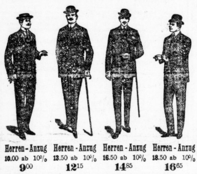
Herren-Anzug 10.00 ab 10%, Herren-Anzug 13.50 ab 10%, Herren-Anzug 18.50 ab 10%, Herren-Anzug 18.50 ab 10% 9.00 12.15 14.85 16.65