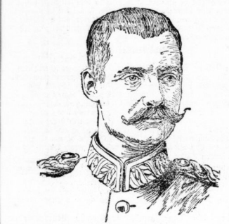
Prinz Rupprecht von Bayern.

Prinz Arnulf von Bayern, der dritte Sohn des Prinzregenten Luitpold von Bayern, ist aus Gesundheitsrücksichten vom Kommando des ersten bayerischen Kavallerie-Regiments zurückgetreten.