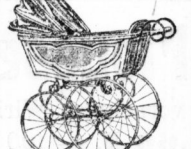
Gr. Posten Kinderwagen