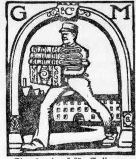
Einzelverkauf für Halle nur Leipziger Str. am Leipziger Turm

Vertrieb von Erzeugnissen sächs. Gardinen Fabriken Georg Methner & Co. Kommandit-Gesellsch. Leipzig u. Halle a. S.