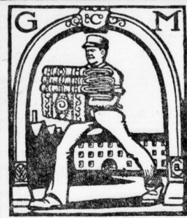
Einzelverkauf für Halle nur Leipziger Str. am Leipziger Turm

Äußerst günstige Gelegenheits-Käufe zu bedeutend herabgesetzten Preisen