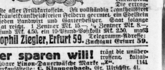
Artenreiche erntebare Kartoffel.

Freitag, 16. April: Beginn neuer Kämpfe um die Borzito-Döbe.