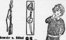
Wohr u. Säbel zusammen 95 Pf.

Lüster-Unterrock-Volants farbig, Stück 95 Pf.