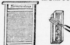
Waschbrett 95 Pf., Brennsherren-Garnitur 95 Pf.

1 Karton Schweizer Sticker-Taschentücher 95 Pf.