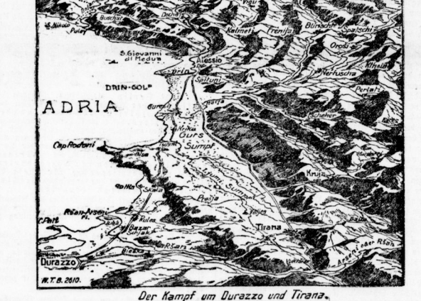
Der Kampf um Durazzo und Tirana.