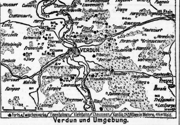
Verdun und Umgebung.