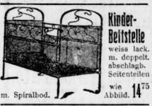
Kinder-Bettstelle weiss lack. n. doppelt abschreibg. seitlichen wie Abbild. 1475 m. Spirabod. . . . .

weiss lack. genau wie Abbildung jetzt 1150 pa. Fabrikat