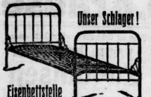
Unser Schlager! Eisenbettstelle mit Kettennetz-Matratze, schwarz 175 und weiss, genau wie Abbildung

Der Verkauf beginnt sofort nach Erscheinen dieses Inserates.