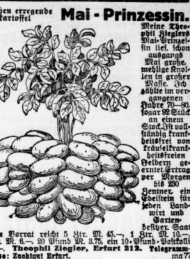
Welt im Bild