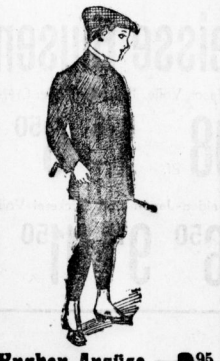
Knaben-Anzüge 2 95 aus dauerhaftem Buckskinstoff, Stick . . . . .