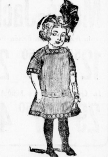
Kinder-Kleider 1 75 in weiss Batist, mit Stickereien u. baumw. Musselin, gestreift Stick.

Stickerei-Unterröcke . . . . . 1 50 | Paradekissen . . . . . 80 Pf. | Kinder-Steppdecken . . . . . 1 50 | Wagendecken . . . . . 85 Pf.