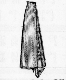
Schwarz-weiße Röcke 2 75 in gestreift und kariert, versch. Ausführungen . . . . . von 1 an