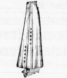
Leinen-Röcke 1 50 mit verschiedenem Besatz von 1 an