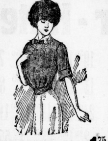
Mille fleurs-Blusen 1 75 in verschiedenen Mustern . . . . .