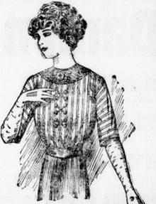
Musselin Imit. Bluse 1 75 in verschiedenen Mustern und schicker Garnierung . . . . .