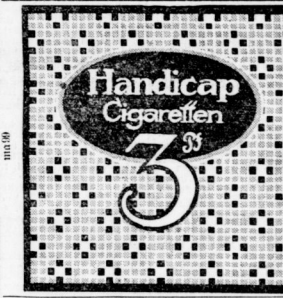
Aus dem Geschäftsversteher.