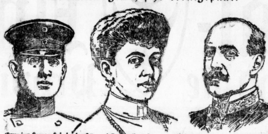
Prinzessin Georg v. Griechenland, Königin Sophie, König Konstantin von Griechenland