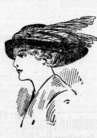
Chasseur mit schlek. Flügel-Garnit. genau wie Abb. 9.75

Serie II: neu mod. Damenhut neueste Farben Wert bedeutend höher. . . jetzt 2.45