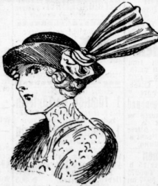
Gamin mit floter Seidengarnit. in versch. Fäsonen, genau w. Abbild. 8.75