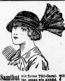
Samtbut mit floter Tüll-Garnit. 7.90 tur, genau wie Abbild.

Serie I: Neue mod. Damenbüte 2.45 1: neueste Farb., jetzt weit unt. Preis