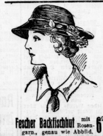
Fescher Backfischhut mit moderner Garnit. genau wie Abbild. 6.00

Serie II: neu mod. Damenhut neueste Farben Wert bedeutend höher. . . jetzt 2.45