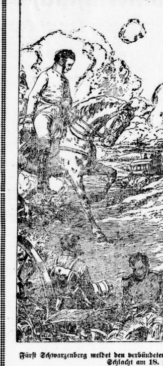
Fürst Schwarzenberg meldet dem verbündeten Monarchen den Sieg nach der Leipziger Schlacht am 18. Oktober 1813.