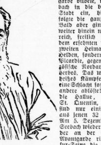
Gustav Adolf Seebach.