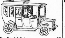
Bär's Spezial-Auto . . . . . 95