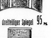
Ein dreiteiliger Spiegel 95 Pf.