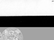
1 Fischständer mit Glas 95