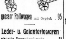
1 grosser Rollwagen mit Gepäck. 95