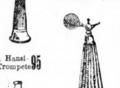
1 Hand-Trompete 95