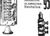
1 Odeurzerstäuber m. umspinn. Netzballon 95