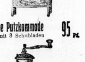
Eine Putzkommode mit 8 Schubladen 95 Pf.