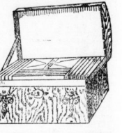
1 eleganter Karton Briefpapier . . . . . 95 Pf.