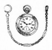
Garant, richtig geb. Herren-Uhr 95 1 hochfeine Kette . . . . . 95