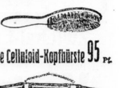
Eine Celluloid-Kopffürste 95 Pf.