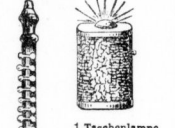
1 Taschenlampe mit Ia. Batterie und Metallfadenbirne 95