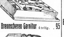
1 Brennsherren Garnitur 4teilig. 95