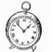
Eine Standuhr garant. richtig gehend 95 Pf.