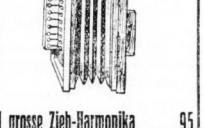
1 grosse Zieh-Harmonika . . . . . 95