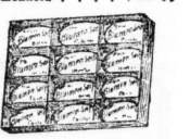
1 Karton 12 Stück Seife . . . . . 95 Pf.