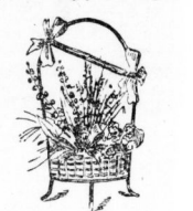
1 grosser Blumenkorb . . . . . 95 Pf.