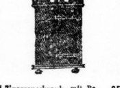
1 Zigarrenschrank mit Beschlag . . . . . 95