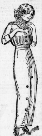
Konfirmanden-Kleid aus gut. schw. Popeline mit Passe und Knöpfchen verziert, genau wie Abbildung 10

Konfirmanden-Kleid aus gutem Satin, eleg. Ausführung mit breitem Einsatz und seidenem Gürtel mit Schärpe . . . . . 19