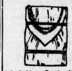
Achselverschluss - Hemd mit Langette . . . . . 95