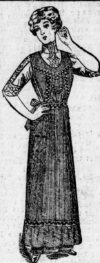
Blusen-Schürze genau wie Abbildung aus gestreiften Siamosen mit Blenden und Stoffgarnitur kostet nur 95