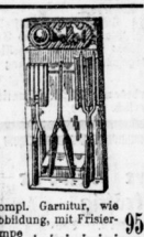
Kompl. Garnitur, wie Abbildung, mit Frisierlampe . . . . . 95