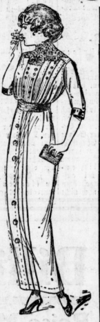
Konfirmanden-Kleid aus la. schw. Popeline m. eleg. Passe u. reich. Knöpfchengarn. 16