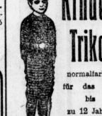
Knaben-Sweater farbig 95