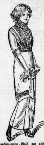
Konfirmanden-Kleid aus prima schw. Popeline, u. reich mit Taill-einsätzen, sowie Seidenrüschen u. Gürtel verziert, genau wie Abbildung 18