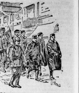
Der Corpschef als Feldherr.