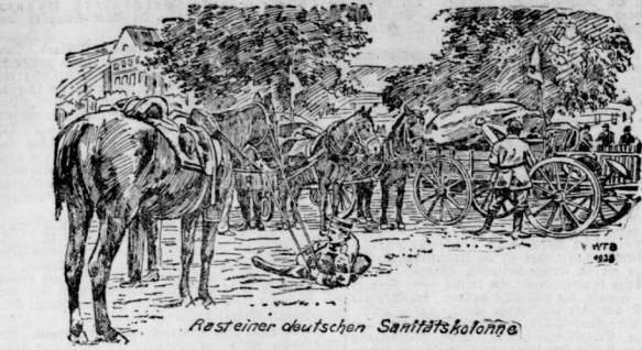
Resteiner deutschen Sanitätskolonne