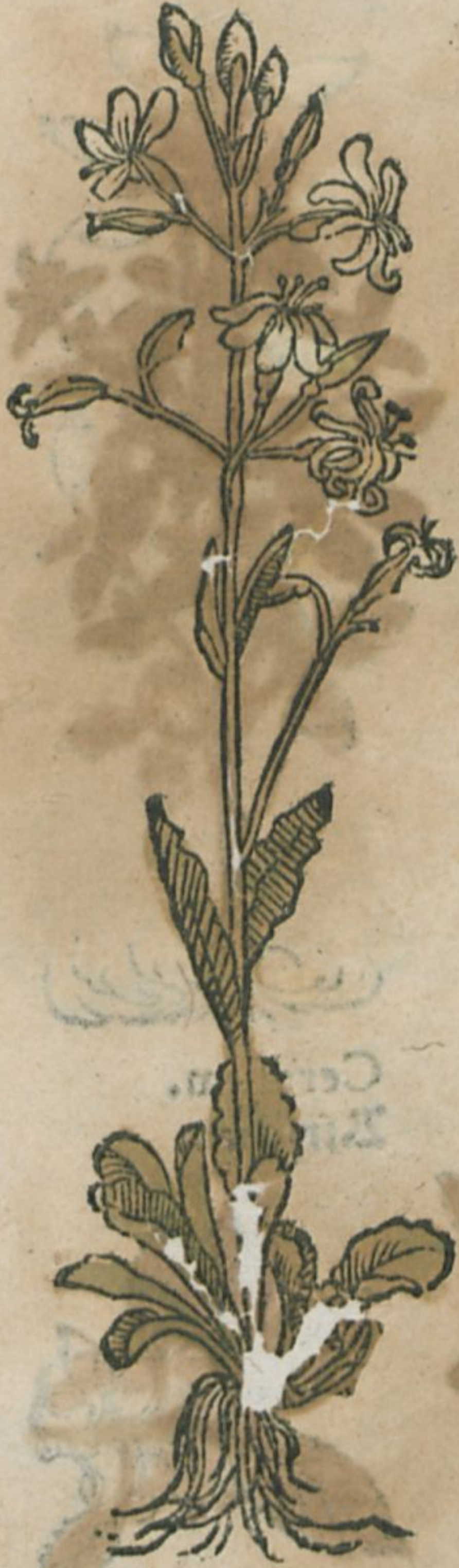
Saxifraga. Weiß Steinbied.