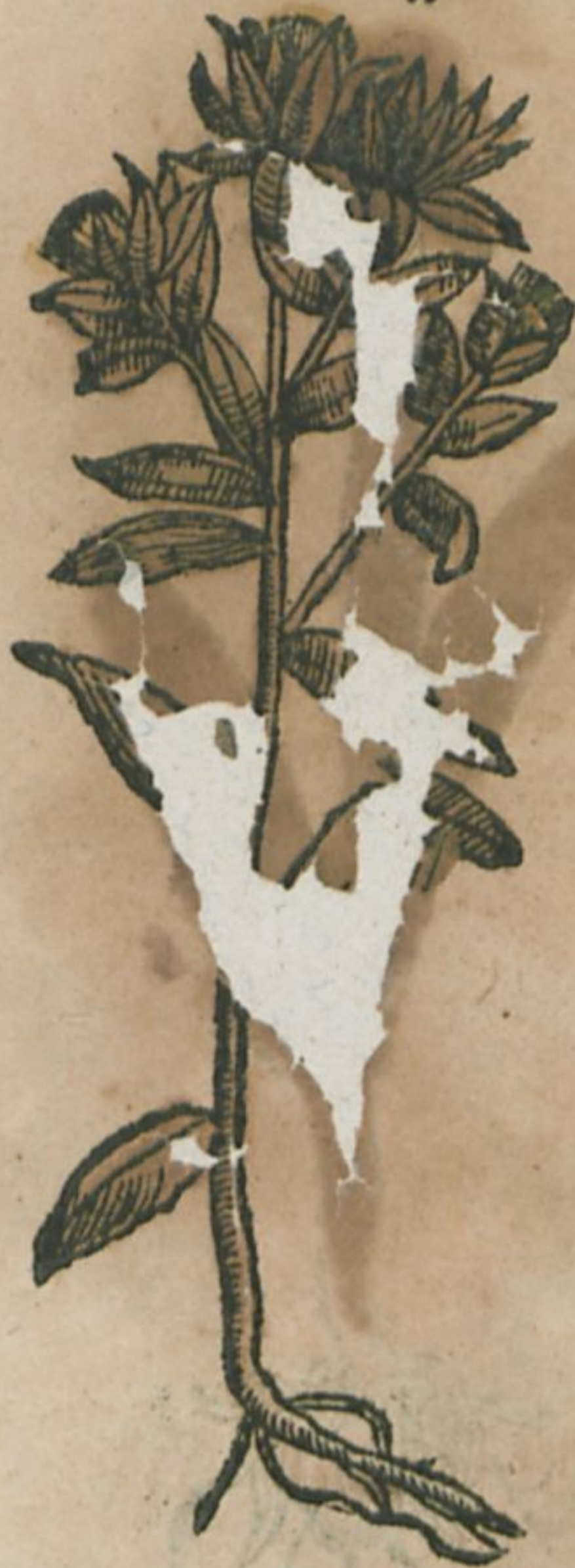
Carthamus. Wild Saffran.