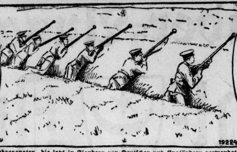
Die Gewehrgranaten, die jetzt in Händen von Deutschen und Engländern verwendet werden.