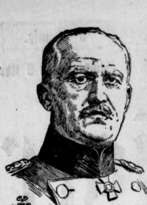
Generalleutnant von Ludendorff