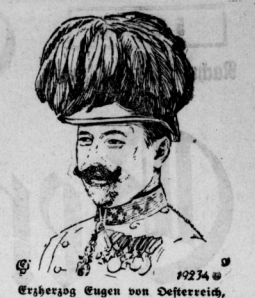
1924 Kaiser Eugen von Österreich, der am Oberkommandierenden der österreichisch-ungarischen Streitkräfte auf dem Balkan erkannt wurde.