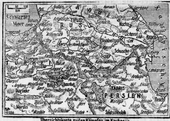
Übersichtskarte zuden Kämpfen im Kaukasus.

Einmal, als die letzten Beschlüsse mit Dolmetschern... Kriegsalterlei.