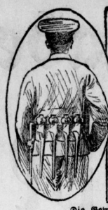
Englischer Soldat mit Gewehrgranaten ausgerüstet.