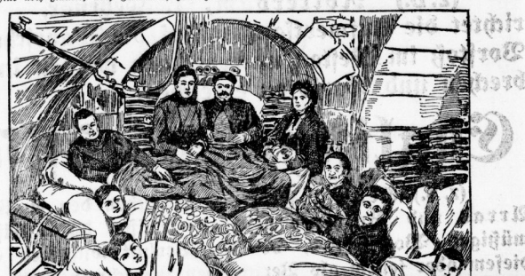
Ein Winterlager während der Besetzung von N. Keller-Böckheim.

scheitern Lebensbedürfnisse zu befriedigen... die russische Staatsverwaltung hat sich im Laufe des Jahres 1914... vor einer Wende in der Geschichte der russischen Staatsverwaltung... befinden.